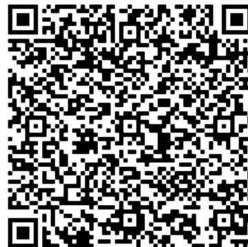
Hinweise des Kultusministeriums