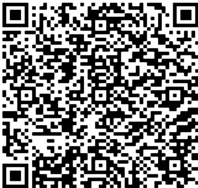
Kursheft für Kurs 81